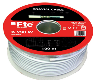
Bobina K 290 W