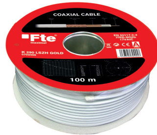
Bobina K 290 LSZH GOLD